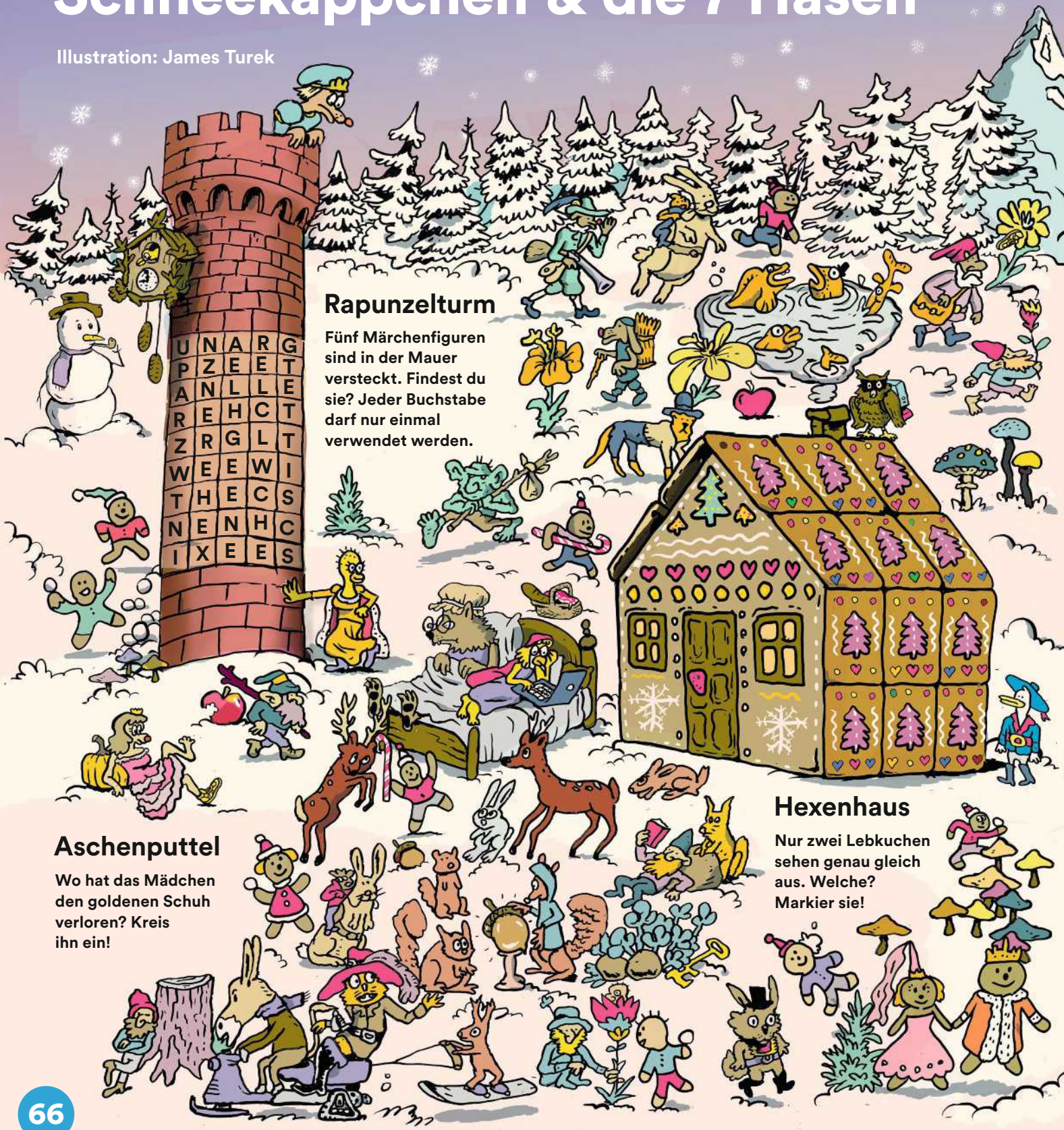
Illustration: James Turek