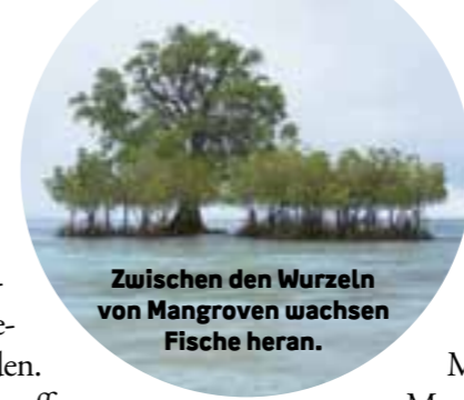
Zwischen den Wurzeln von Mangroven wachsen Fische heran.

mitmachen wollen, lässt er zu Meerewächtern ausbilden. Einmal im Monat treffen sich etwa 30 Ranger in der Bürgerhalle ihres Dorfes oder im Wachturm des Schutzgebietes. Sie lernen viel über das Meer und seine Bewohner; darüber, welche Fischfangmethoden verboten sind, und warum es so wichtig ist, die Mangrovenbäume zu schützen.