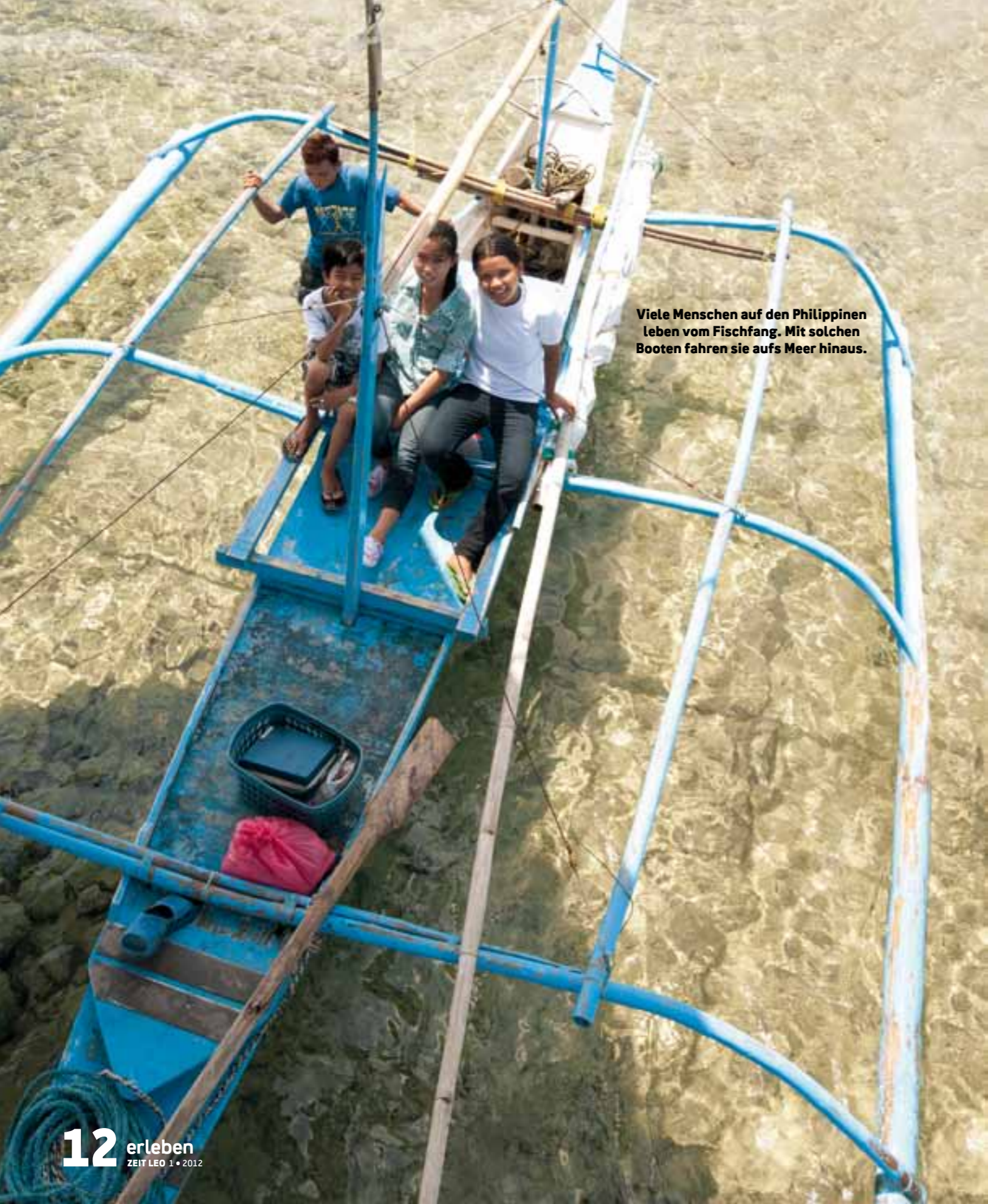
Viele Menschen auf den Philippinen leben vom Fischfang. Mit solchen Booten fahren sie aufs Meer hinaus.