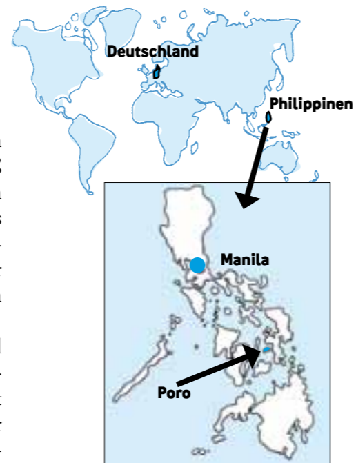
Die Philippinen bestehen aus mehr als 7000 Inseln im Pazifik.