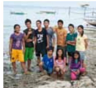
»Sie sind die Augen und Ohren des Schutzgebietes«: Die Kinder-Ranger passen auf, dass niemand dort fischt, wo es verboten ist.